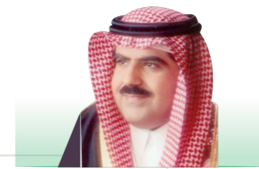
سمو الأمير محمد بن خالد آل سعود عضو مجلس الإدارة