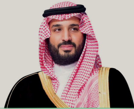
صاحب السمو الملكي الأمير محمد سلمان بن عبدالعزيز آل سعود وليّ العهد ونائب رئيس مجلس الوزراء – وزير الدفاع