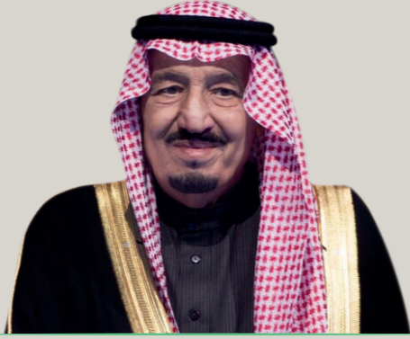
خادم الحرمين الشريفين الملك سلمان بن عبدالعزيز آل سعود