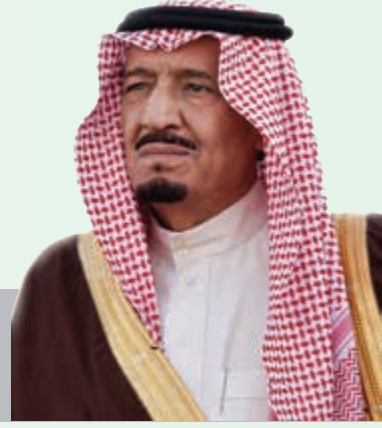
خادم الحرمين الشريفين الملك سلمان بن عبدالعزيز آل سعود