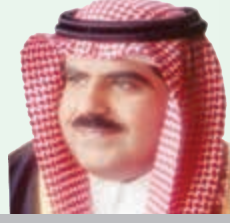
سمو الأمير محمد بن خالد بن تركي آل سعود (رئيس مجلس الإدارة)