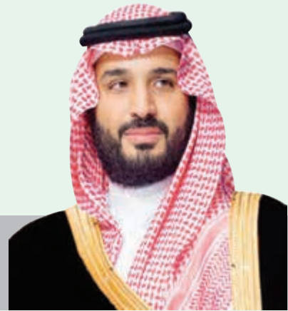
الأمير محمد بن سلمان بن عبدالعزيز آل سعود ولي العهد ونائب رئيس مجلس الوزراء ووزير الدفاع